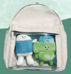
一帆布袋囉娃娃+口袋小子娃娃