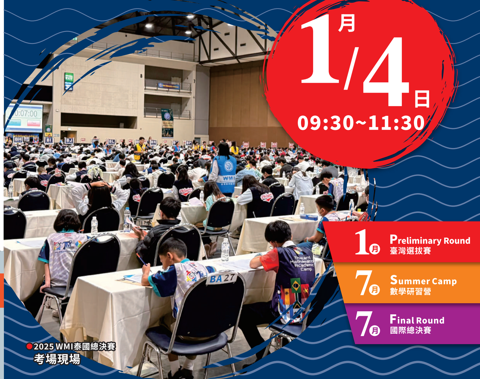
● 2025 WMI泰國總決賽 考場現場