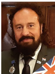
President of the International Jury