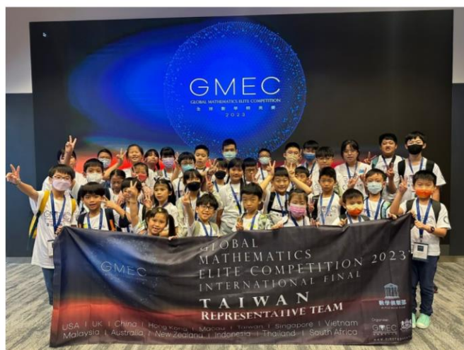
※2023 年 台灣代表隊