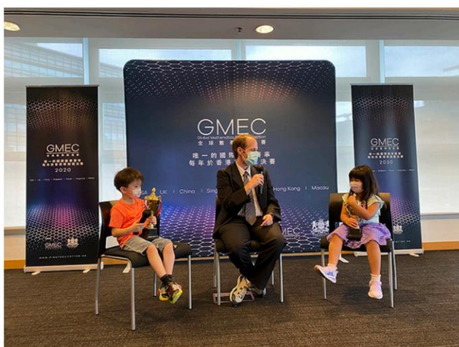
※2020 年 與教授的一席話

2. AoPS 遊學團獎金：全球冠軍將獲得參加 AoPS 遊學團的全額獎學金。（僅包含課程）