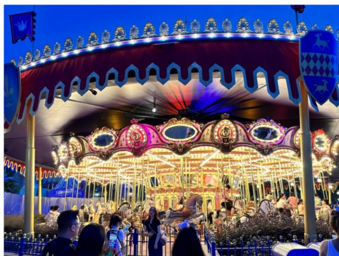
※2023 年 前進香港迪士尼