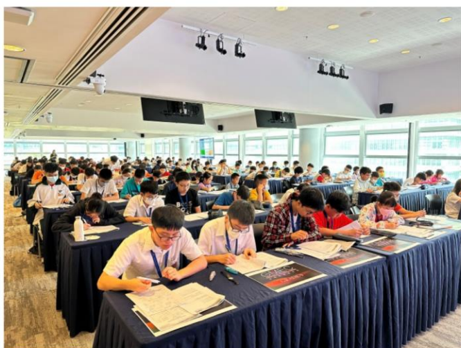
※2023 年 GMEC 總決賽現場