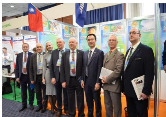
▲ 當地廠商蒞臨台灣展區洽談合作