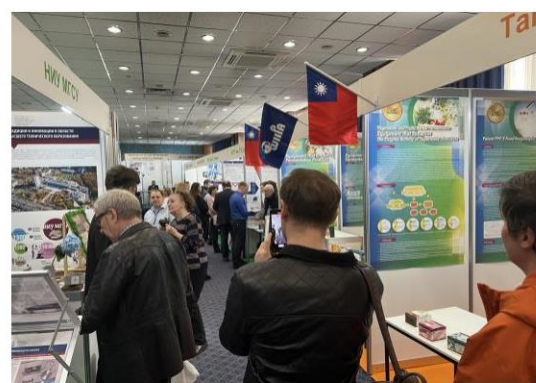
▲ 主辦單位特地為 WIIPA 與 TIPPA 團隊安排在最明顯的國際展區